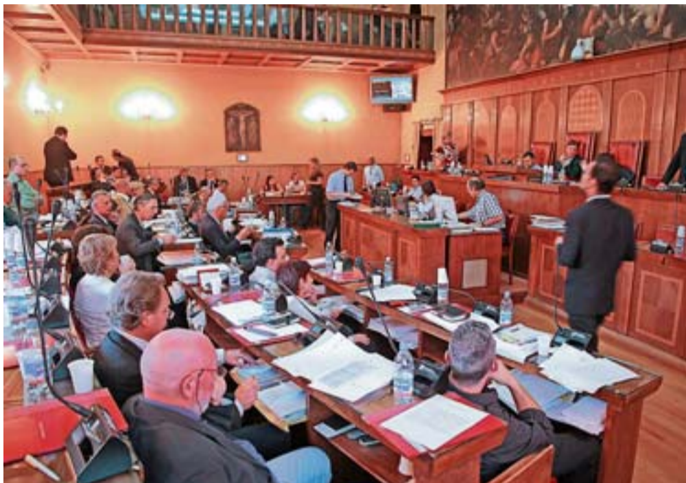
Seduta fiume del Consiglio comunale che ha approvato il Pat dopo una notte di votazioni

Giacino e il sindaco hanno ringraziato i consiglieri di maggioranza «per l'impegno e la determinazione». ♦ ES.